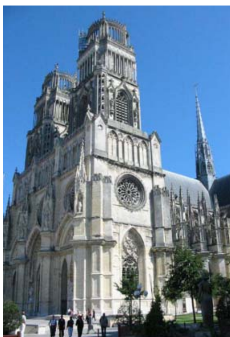
Katedrála Sv. Kříže v Orleans

Zde jsme z mapy města, kterou jsme si zakoupili u pumpy, objasnili jednu malou záhadu, a totiž že městečko Boigny-sur-Bionne v průběhu věků splynulo s Orléansem a stalo se jedním z jeho samostatných předměstí, čímž logicky jako samostatný celek vymizelo z map.