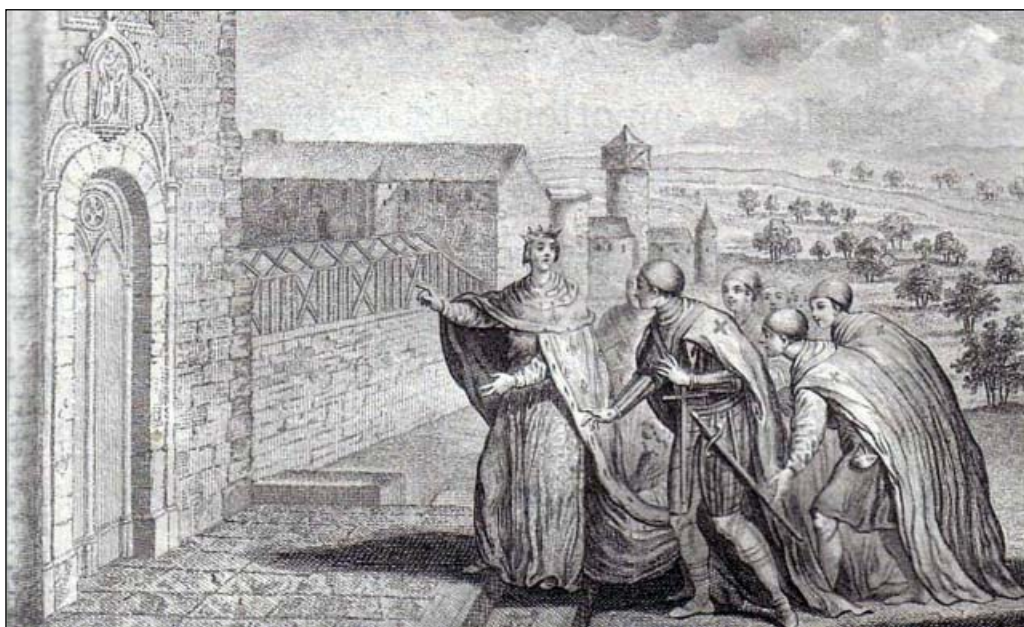
Řádoví rytíři jsou v r. 1154 uváděni do Boigny králem Ludvíkem VII.