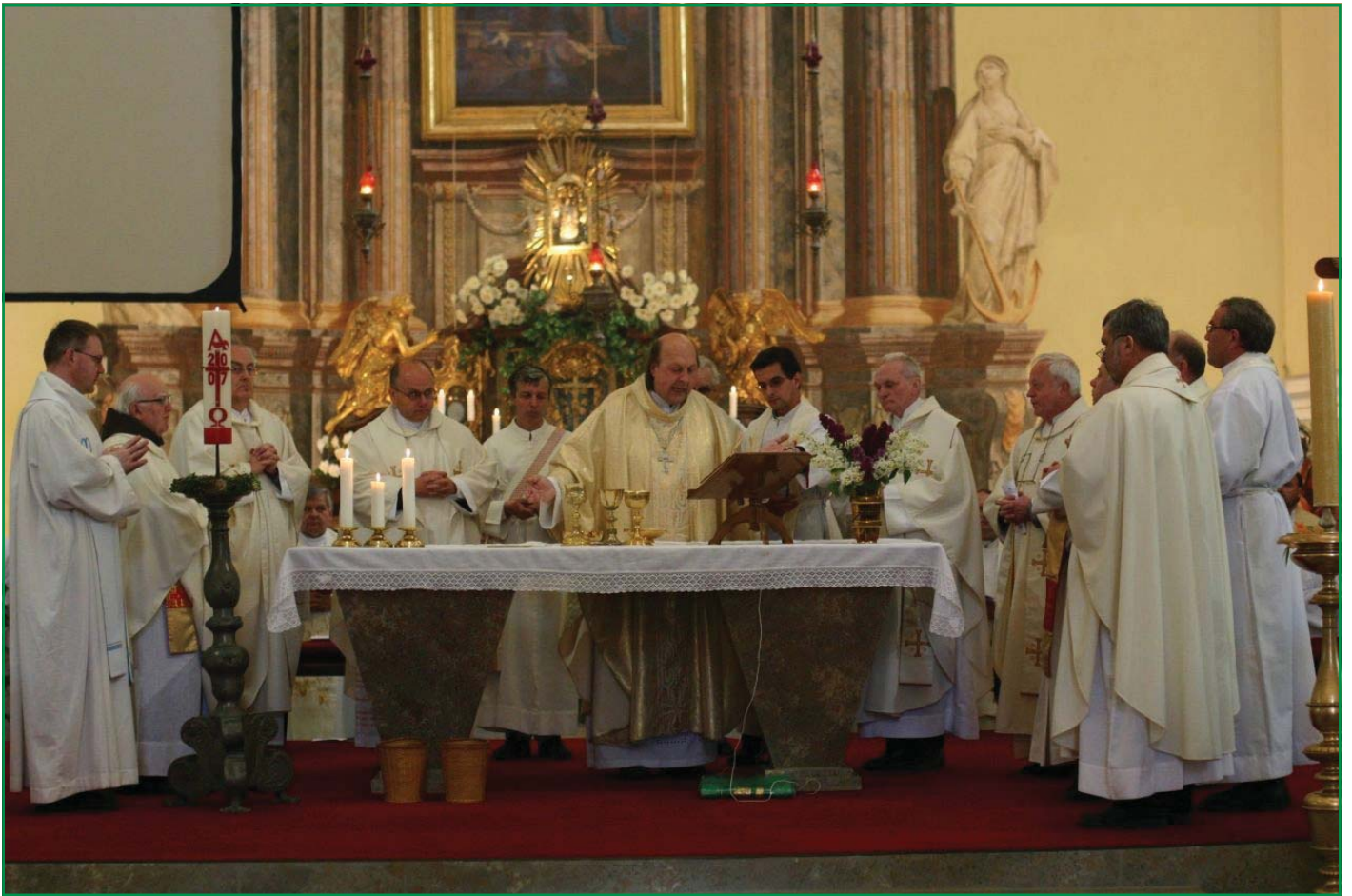
FOTOGRAFIE Z HEJNIC